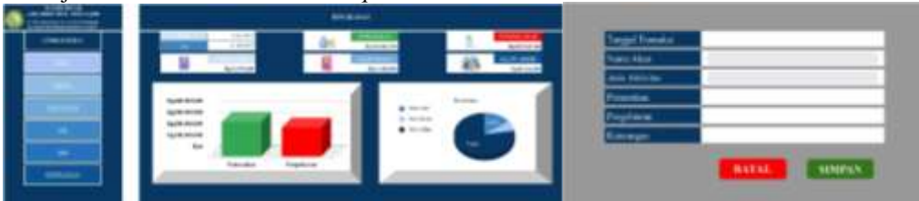
Gambar 3. Dashboard dan Form Input

Berikut gambar template laporan keuangan yang telah dirancang oleh penulis dan diimplementasikan oleh bendahara Masjid Besar Ash-Shirothol Mustaqim :