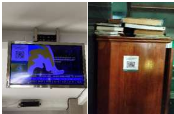
Gambar 2. Publikasi di Monitor Masjid dan Publikasi menggunakan Stiker

Berikut gambar QR Code yang tersedia di monitor masjid dan stiker yang ditempel di area tertentu: