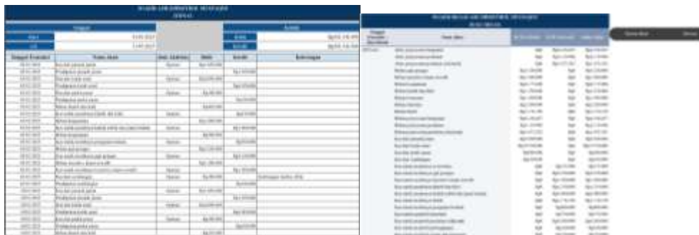
Gambar 4. Jurnal dan Buku Besar