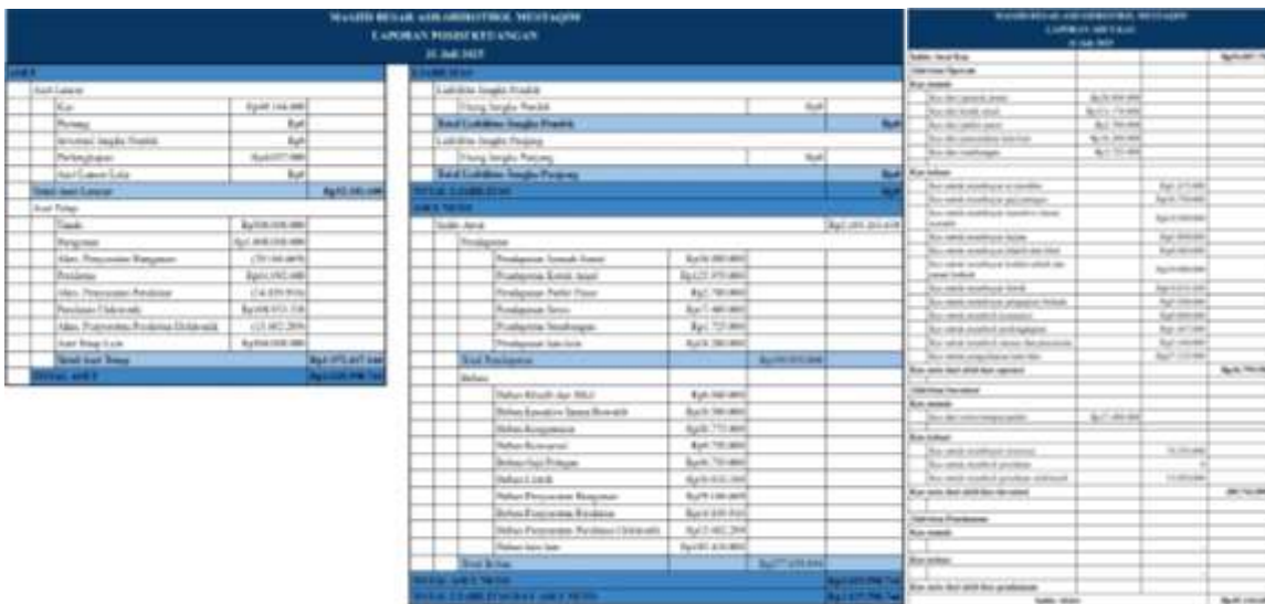
Gambar 5. Laporan Posisi Keuangan dan Laporan Arus Kas