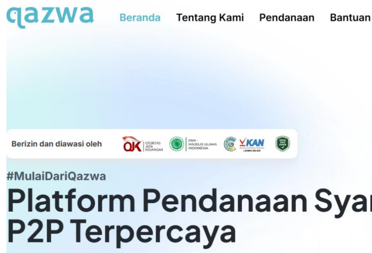
Gambar 1 (izin resmi dari OJK dan DSN-MUI)

PT Qazwa Mitra Hasanah yang terbentuk pada tahun 2018, dan sudah mengantongi izin di OJK pada tanggal 24 Agustus 2021. Dari hasil observasi yang termuat dalam dokumentasi halaman dari sebuah aplikasi Qazwa, menyimpulkan bahwa Qazwa juga adalah fintech syariah yang sudah mengantongi izin dari OJK, DSN-MUI, serta yang membolehkan akses secara bebas untuk publik, baik pengguna maupun bukan pengguna, untuk mengunduh draft akadnya.